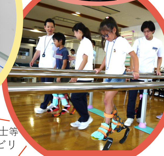
理学療法士等 とのリハビリ