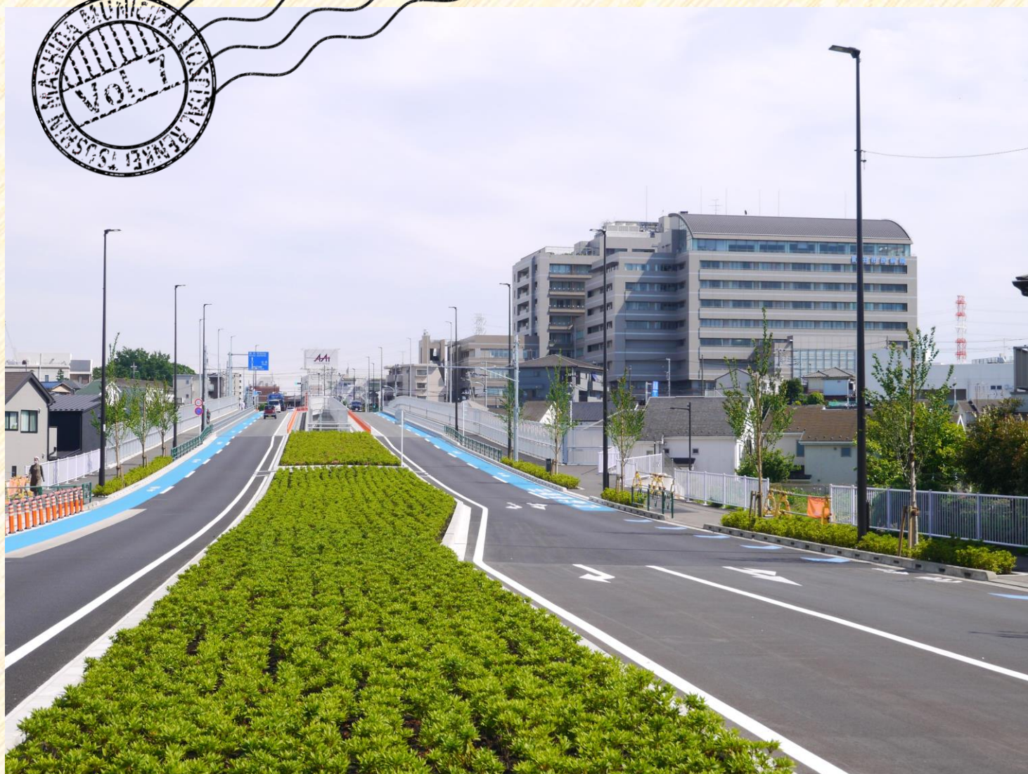
町田市民病院と2024年3月に開通した新町田街道「旭町大橋」