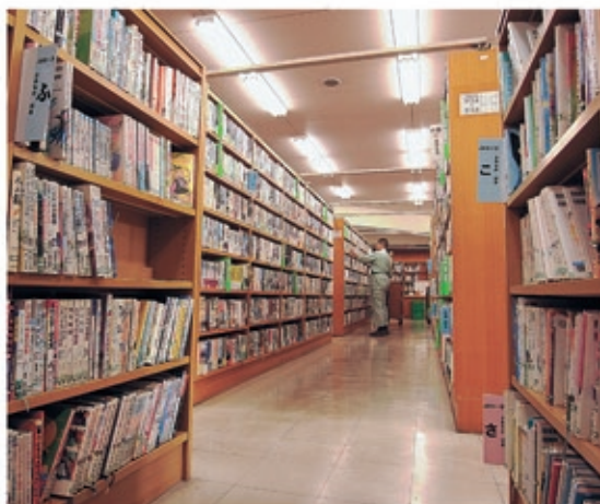
○市民病院から徒歩15分(駐車場有) □中町2丁目13-23

「書館」と館名変更しました。移動図書館「そよかぜ号」の基地としても機能し、大切な役割を担っています。蔵書は約13万冊、雑誌約160タイトル、絵本、紙芝居などの児童書は中央図書館に次いで多く所蔵し、広く市民に愛されています。