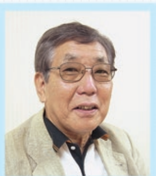
元共同通信社記者